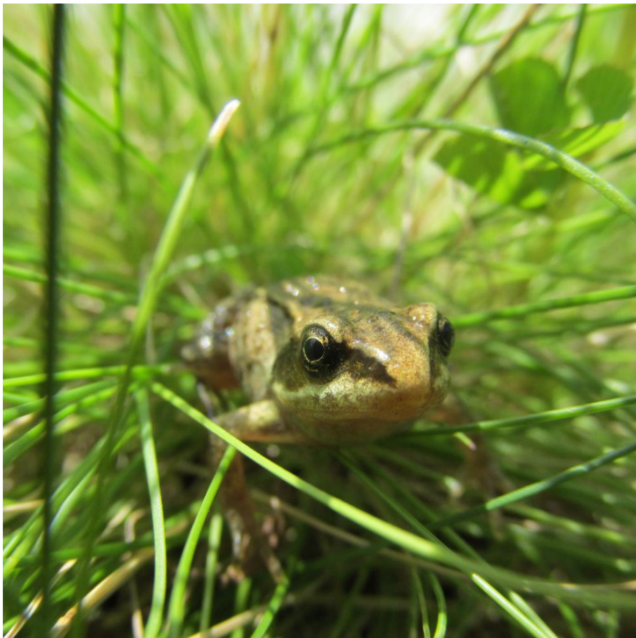
Изумрудная (Л.К. Горшкова, 2 место)