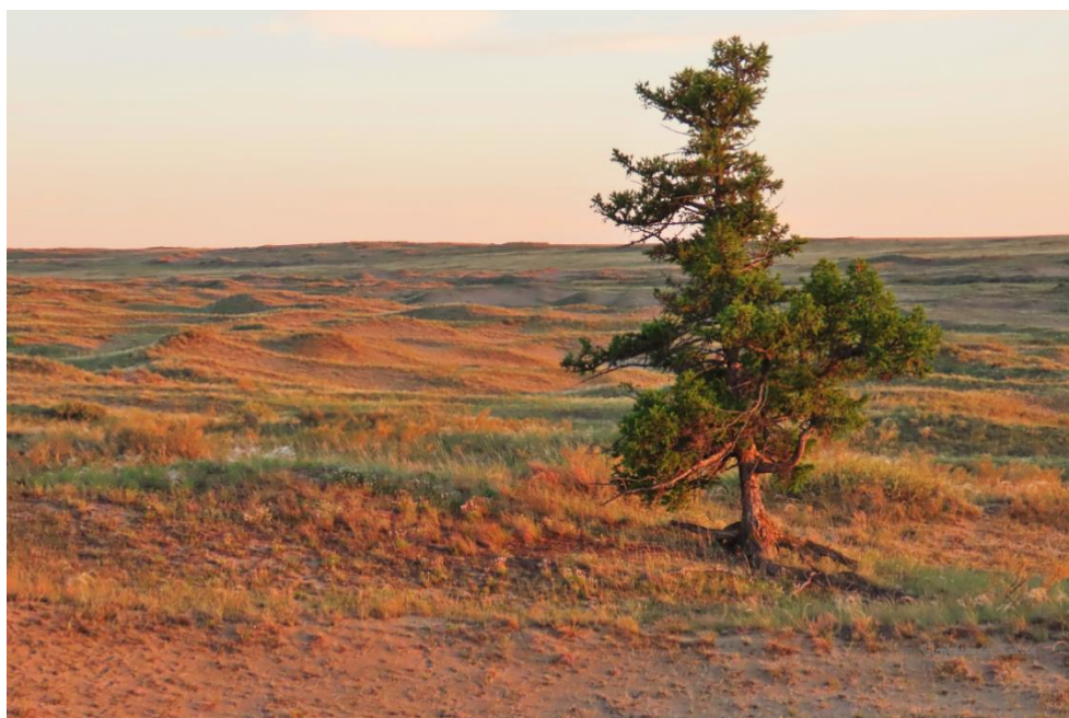
Лиственница в песках (А.Н. Куксин, 2 место)