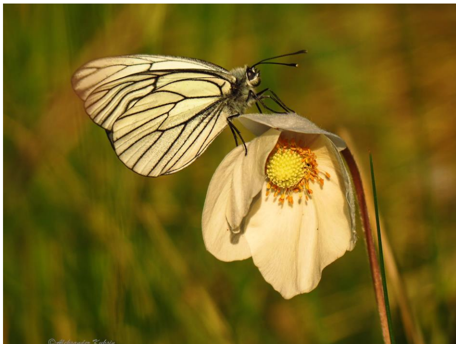
Боярышница на шиповнике (А.Н. Куксин, 1 место)