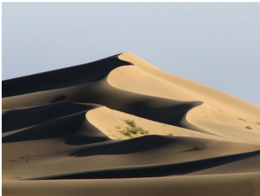
Музыка на песке... (Д.А. Лыхин, 3 место)