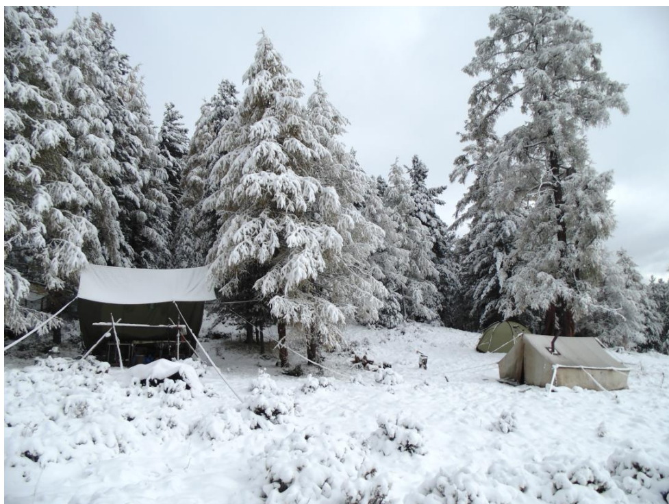
Первый снег (Ю.В. Бутанаев, 2 место)