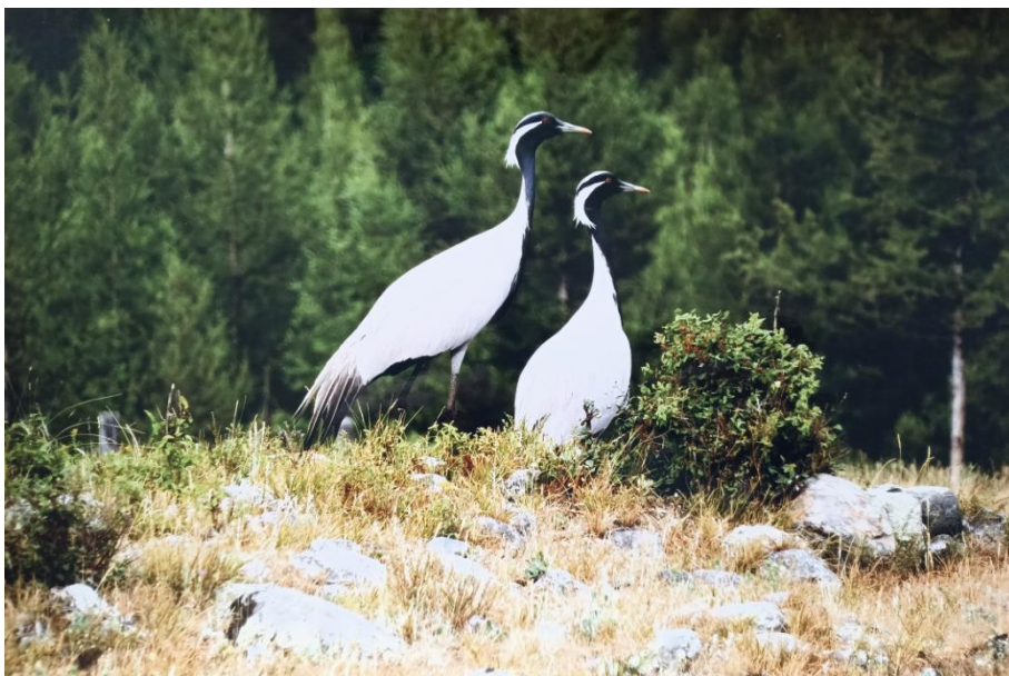
Пара журавля-красавки (А.Н. Куксин, 3 место)